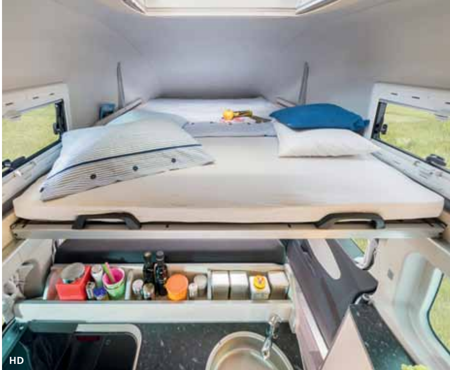
◀ Das 141 x 210 cm große Doppelbett im hellen und freundlichen Hochdachbereich bietet erholsamen Schlaf durch komfortable Federelemente und drei Fenster für viel Frischluftzufuhr.