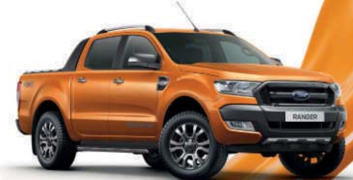
Outdoor-Orange 2) Metallic-Lackierung*

Wir haben uns für Outdoor-Orange entschieden. Welche Farbe ist Ihr Favorit?