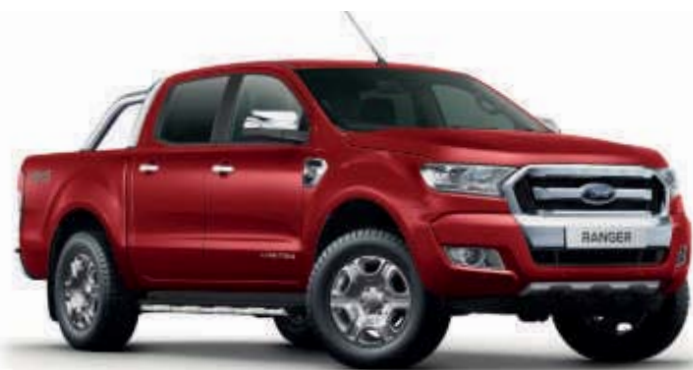
Copper-Rot 1) Metallic-Lackierung*