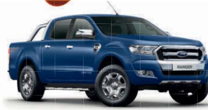
Ocean 1) Metallic-Lackierung*