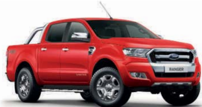
Colorado-Rot 1) Normalfarbe