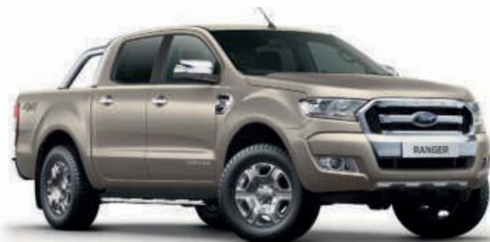
Sahara 1) Metallic-Lackierung*