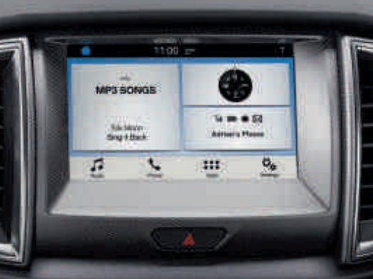
Ford SYNC 3* mit 20,3 cm-Touchscreen und Sprachsteuerung