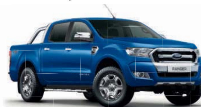
Indianapolis-Blau 1) Metallic-Lackierung*